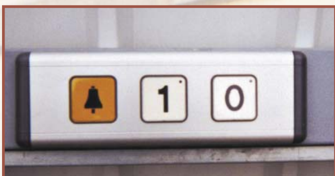
Boîte commande cabine

Appareil en service opposé autoportant, installation en étage, cuvette de 100 mm.